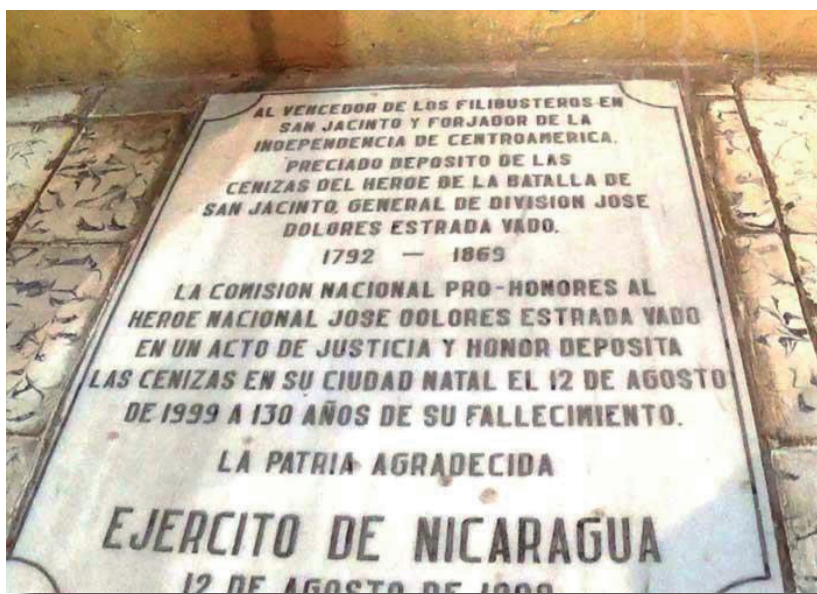
Lápida de la tumba donde descansan las cenizas del General José Dolores Estrada, 12 de agosto de 1999.