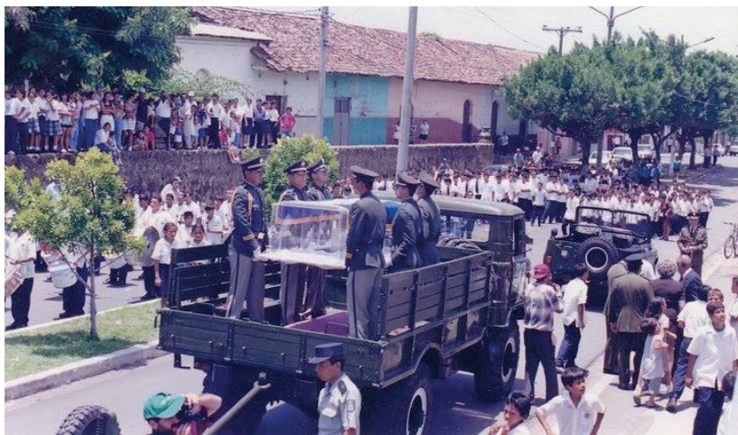
El Ejército de Nicaragua a su paso por Granada, camino a Nandaime, llevando las cenizas del General José Dolores Estrada, agosto de 1999.