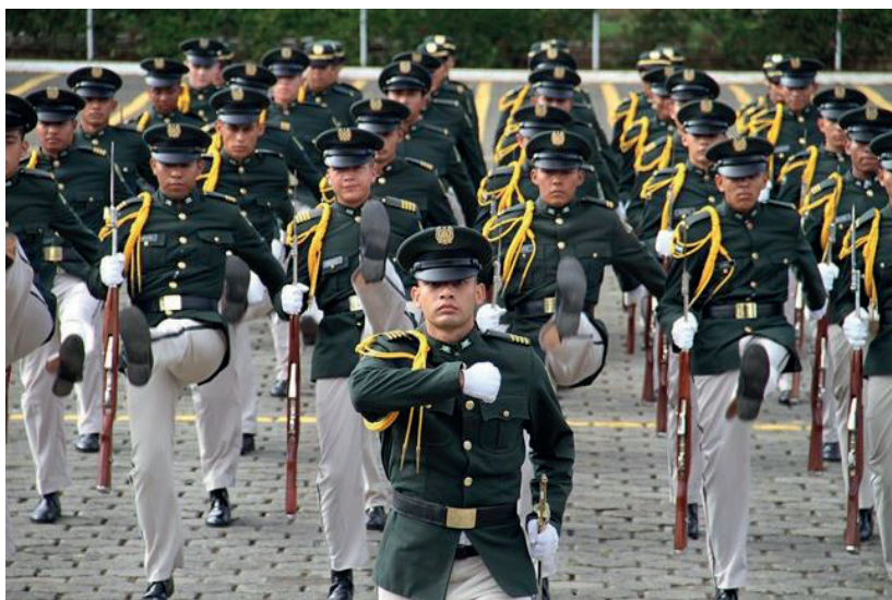
Ejército de Nicaragua rindió honores al General José Dolores Estrada.