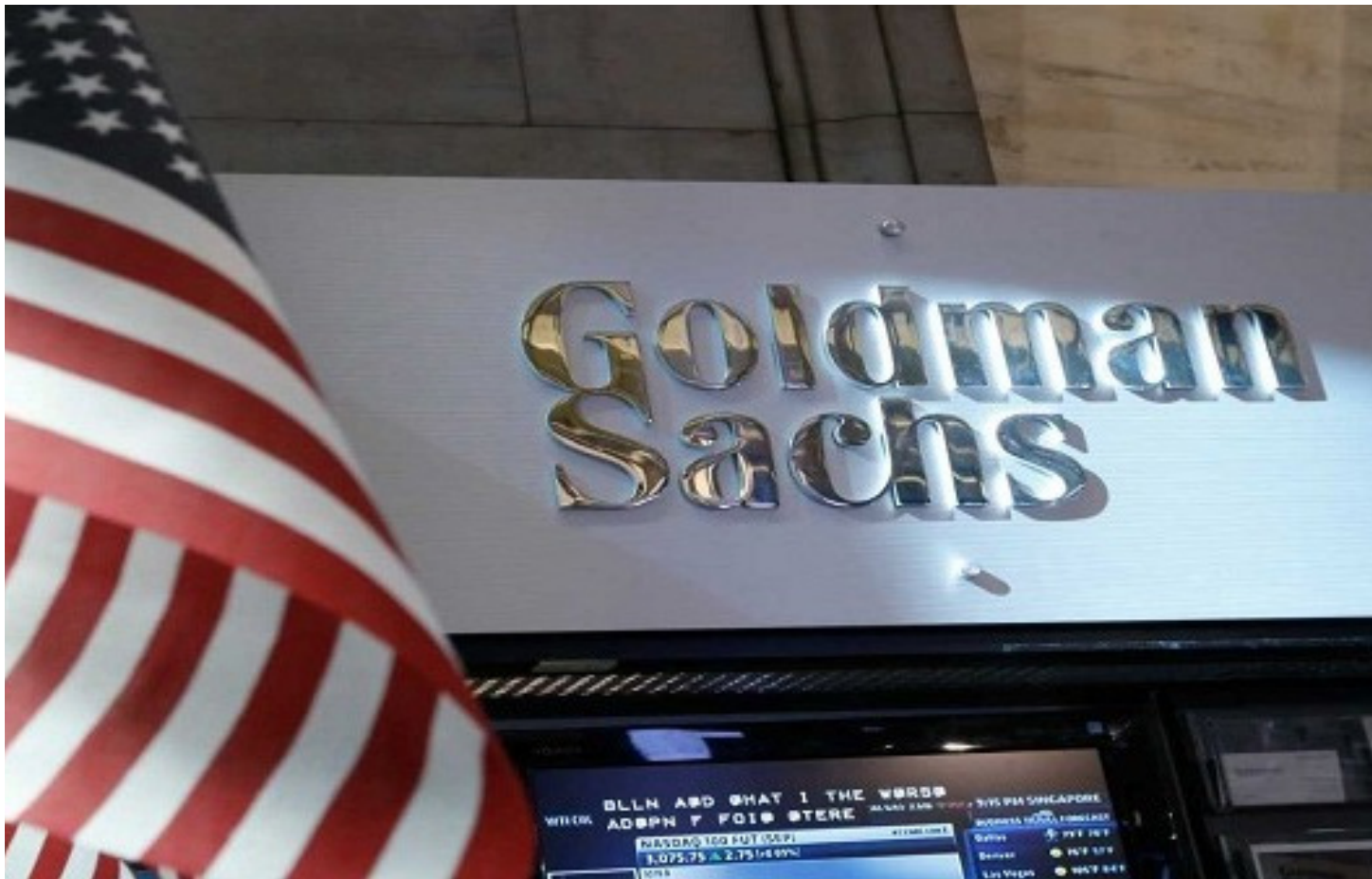
ANUNCIO: Goldman Sachs Group, Morgan Stanley y JPMorgan Chase rectificaron sus balances.

Tres de los bancos más grandes del mundo modificaron su diagnóstico, y prevén un aumento significativo del precio del petróleo durante 2018.