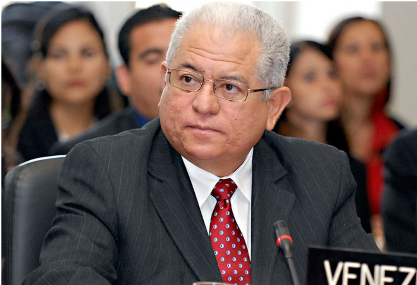
EMBAJADOR: Jorge Valero lamentó la estrecha relación de Zeid Ra'ad Al Hussein con la oposición venezolana.

Venezuela acusó ayer al Alto Comisionado de Naciones Unidas para los Derechos Humanos, Zeid Ra'ad Al Hussein, de entrometerse en sus asuntos internos.