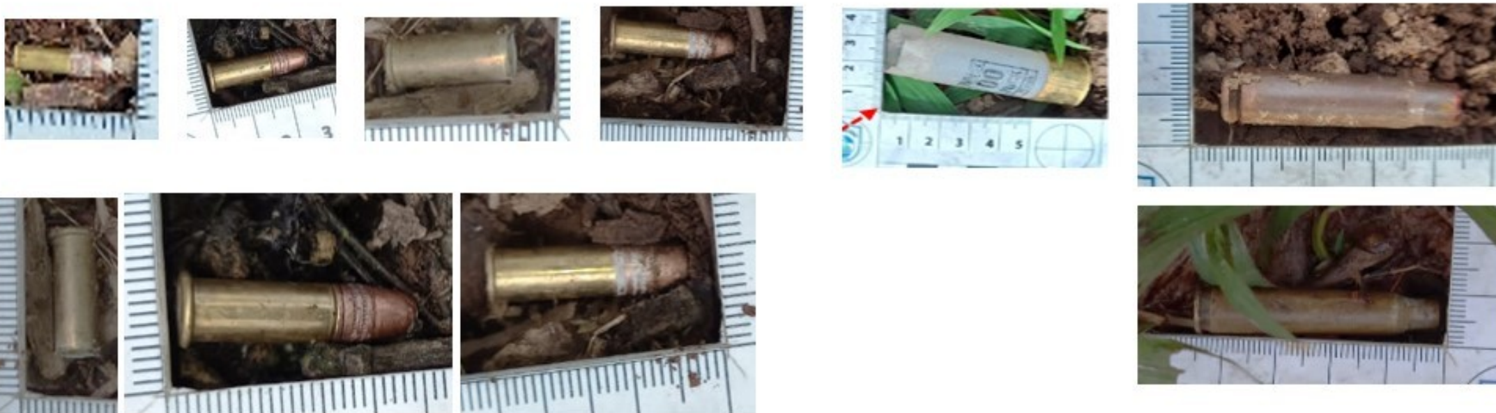
Casquillos percutidos y proyectiles de diferentes calibres