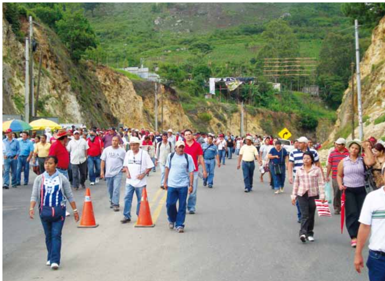
La caminata que se realiza en el occidente de Honduras llegará a las 6:00 PM a la colonia de 6 de Mayo en Santa Bárbara.

Se le hace una invitación a toda la gente que salga a unirse a esta caminata y a que también compartan con los marchantes todo lo que puedan, ya sean frutas, agua, comida, dulces u otro alimento o medicamentos que puedan llevar en el camino.