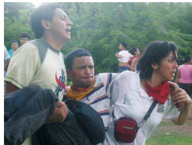
La mayoría de los estudiantes rechazaron al candidato Santos.

Santos busca la presidencia, después que la Constitución se lo impide por haber renunciado a su cargo.