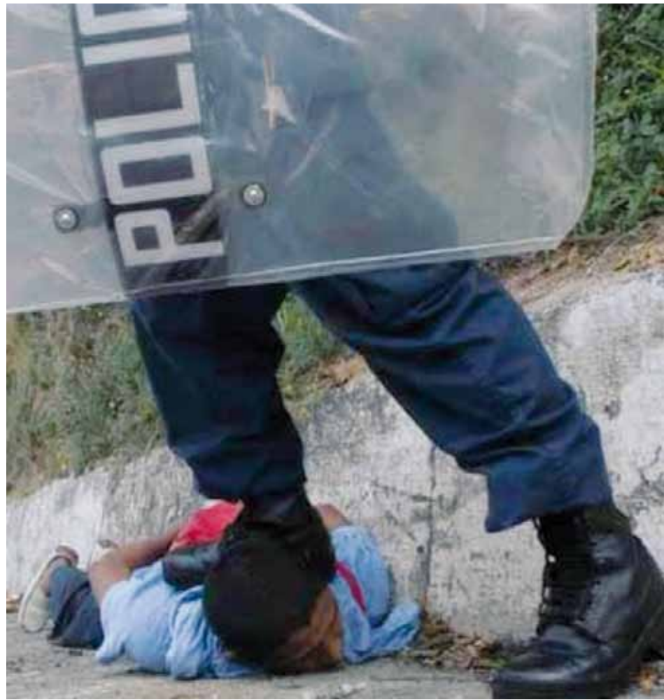
Los estudiantes de diferentes carreras de han organizado en el Frente Nacional de Resistencia.

Los dirigentes de seis colegios están unidos en la lucha, lo que equiva a 50 mil profesionales en todo el país.