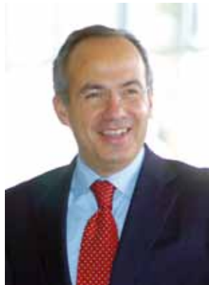
Felipe Calderón, México.

de Estado que sufrió su país. Calificó el golpe como una barbarie que regresa a formas que se creían superadas.