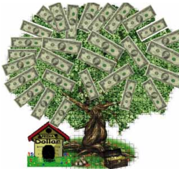
Las familias poderosas de CA, se unen por sus intereses.

Por su parte, sin identificarlos, el presidente costarricense,